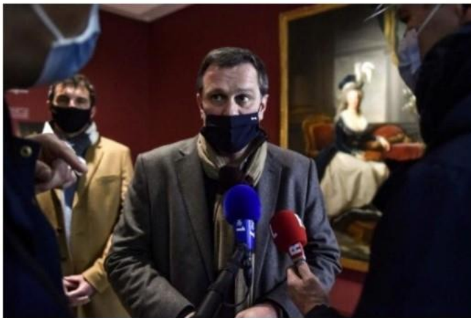
Le maire de Perpignan, Louis Aliot (Rassemblement national), s'adresse à la presse au Musée d'art Hyacinthe-Rigaud, le 9 février.

Il s'agit d'une première en France. Le maire de Perpignan, Louis Aliot (Rassemblement national, RN), a rouvert, mardi 9 février, quatre musées de la ville. Une décision prise malgré une saisine de la justice et le maintien de la fermeture de tous les musées du pays en raison de l'épidémie de Covid-19.