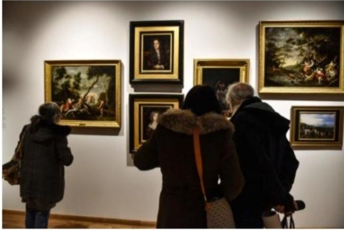
Des gens visitent l'exposition « Portraits de reines de France », au Musée d'art Hyacinthe-Rigaud, à Perpignan, le 9 février.

Le préfet des Pyrénées-Orientales a saisi lundi soir le tribunal administratif de Montpellier pour suspendre les arrêtés de réouverture du maire. Selon le cabinet de M. Aliot, l'audience est prévue lundi prochain à 11 heures.