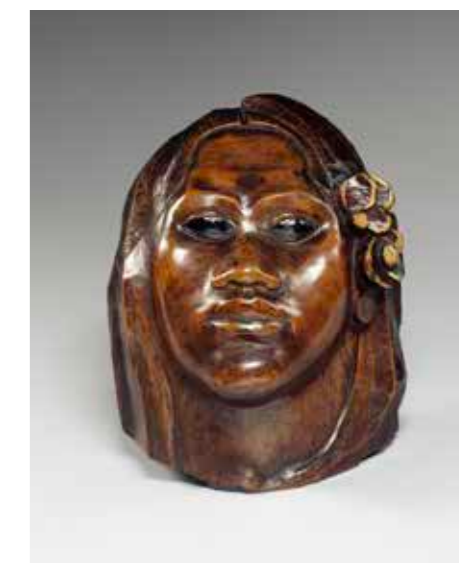
Paul Gauguin (1848-1903). Tehura, 1891-1893. Masque en bois. Paris, Musée d'Orsay.