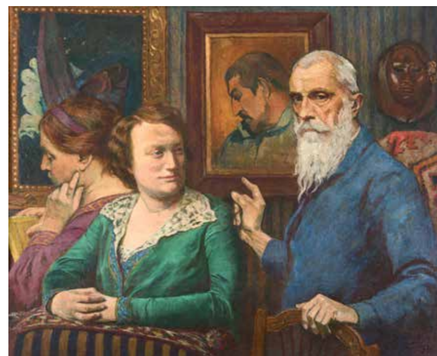
George Daniel de Monfreid (1856-1929). Hommage à Gauguin, 1925. Huile sur papier marouffé sur toile. Perpignan, Musée d'art Hyacinthe Rigaud.