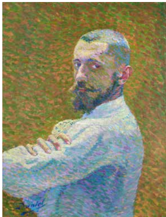
George Daniel de MONFREID (1856-1929). Autoportrait à la veste blanche, 1889. Perpignan, musée d'art Hyacinthe Rigaud.

Cette exposition s'adosse à la politique d'acquisition menée par la commune de Perpignan en faveur du musée d'art Hyacinthe Rigaud qui, depuis 2020, s'est engagé dans la préparation de ce projet en enrichissant ses collections par d'importants achats. Ainsi, le public pourra découvrir des œuvres jusque-là confidentielles , peu ou pas étudiées, avec la volonté d'enrichir la connaissance de l'histoire de l'art :