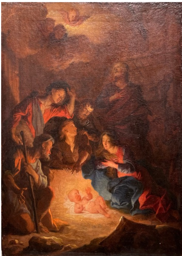
Hyacinthe Rigaud (1659-1743)

que deux autres peintures achetées par la Ville de Perpignan en 2025 :