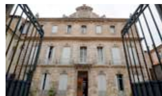
Académie militaire, créée par le Maréchal de Mailly - XVII e s.