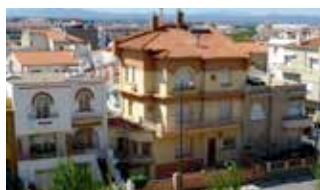
Maisons art déco - Années 30.