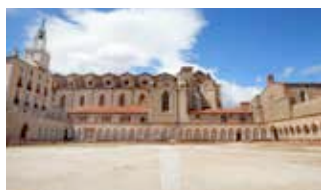
Campo Santo, cloître cimetière - XIV e s.