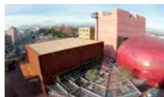
Théâtre de L'Archipel - Années 2000.