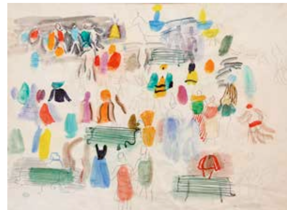
Raoul Dufy, Carnaval, place Arago à Perpignan , vers 1946. Mine graphite et aquarelle sur papier, 47,5 x 62,5 cm. Legs de Mme Raoul Dufy, 1963. Paris, Centre Pompidou, musée national d'Art moderne. En dépôt à Perpignan, musée d'Art Hyacinthe Rigaud. © ADAGP Paris, 2018 © Service Photographie, Ville de Perpignan.

• Samedi 3 et dimanche 4 novembre de 14 h 30 à 16 h 30.