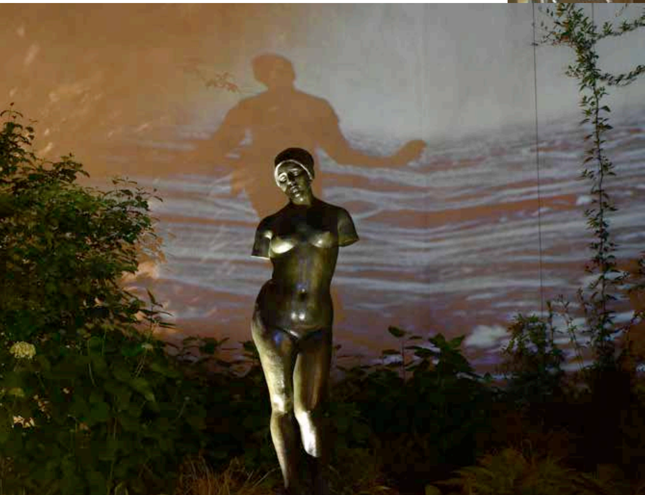
Thomas Pénanguer, Nuit des musées 2018 .