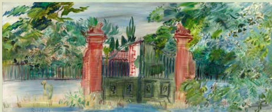
Raoul Dufy, La Grille du jardin (Le Boulou), 1942. Huile sur toile, 38,5 x 92 cm Legs de Berthe Reysz, 1975 - Musée d'Art moderne de la Ville de Paris. Inv. AMVP2041 - © ADAGP, Paris 2018.