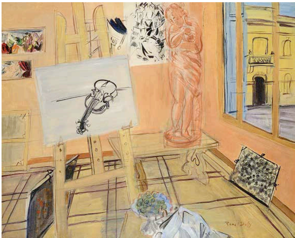
Raoul Dufy, L'Atelier aux raisins . @ Musée des beaux-arts de Lyon. © ADAGP, Paris 2018.