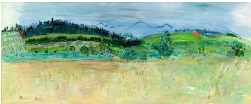
Raoul Dufy, Paysage des Pyrénées-Orientales, route du Boulou , 1942. Huile sur toile 38,5 x 92 cm. Legs, 1975, collection Musée d'art moderne de la Ville de Paris.