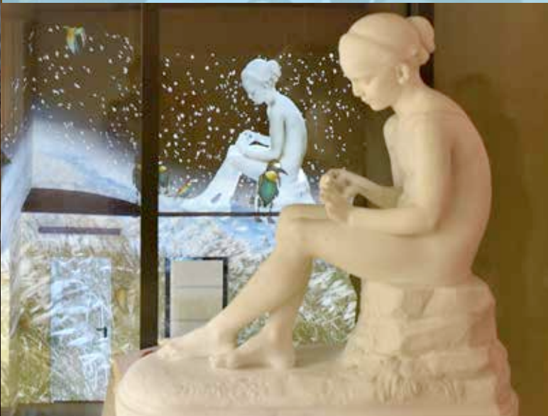
Thomas Pénanguer, Nuit des musées 2018 .