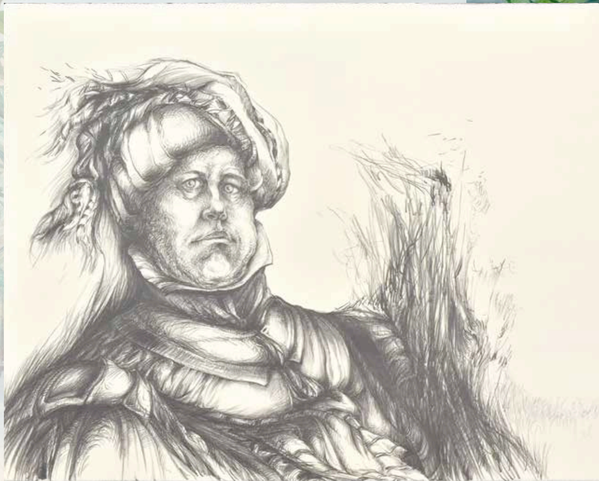
Jacque Barral, Autoportrait